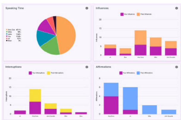
Figure 1. Dashboard using RIFF video

그러나 개발과정에서 실제 사용자인 교수자의 요구나 의견은 반영되지 않았다. 개발된 대시보드에 대한 효과성도 사용 집단과 통제 집단간 학습 동기, 만족도, 태도 등을 비교하고 있어 교수자가 느끼는 실제 효과성을 파악하기 어렵다. RIFF video를 활용하여 참여자의 말하기 시간(speaking time), 누가 서로 대화를 주고 받았는 지를 나타내는 영향(influence)과 방해(interruption), 표현(affirmations), 모든 참여자들의 발언 시간을 보여주는 타임라인(time line)으로 구성된 분석을 보여준다[20]. 62명이 참여자들을 대상으로 한 결과, RIFF video를 사용할 때마다 말하기 시간과 빈도가 2배 이상 증가하였으며, 4회 이상 사용한 학습자가 80% 이상 높은 성적을 받았다(Fig. 1 참조).