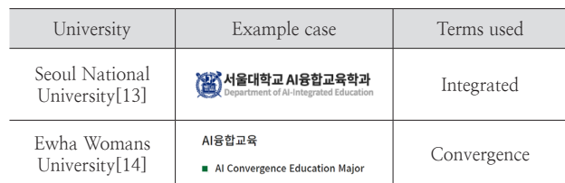
Table 3. English name of the Department of AI Convergence Education in the Graduate School

2011년 STEAM(Science, Technology, Engineering, Art, Mathematics) 교육이 도입되면서 교육과학기술부는 해당 정책의 명칭을 ‘융합인재교육’으로 공식화했다[13, 14]. 이를 계기로 국내에서 ‘융합교육’이라는 용어가 본격적으로 사용되기 시작했다[13]. 김주아 외[14]는 이 과정에서 통합교육과정(Integrated Curriculum)과 융합인재교육(STEAM)의 개념이 혼용되면서, ‘통합’과 ‘융합’ 간의 개념적 경계가 불분명해졌다고 지적했다. 하지만 두 개념 모두 여러 과목이 결합하여 새로운 것을 형성한다는 점에서 개념적 차이가 크지 않다는 관점도 있다[14]. 현재 국내 연구자들은 강조하고자 하는 융합의 특성에 따라 해당 개념을 convergence, integrated, interdisciplinary 등으로 다양하게 번역하여 사용하고 있다[14]. 이러한 용어 혼용은 국내 인공지능 융합교육을 선도하는 인공지능 융합교육대학원의 명칭 표기에서도 확인된다. Table 3과 같이 서울대학교 AI융합교육학과는 AI-Integrated Education, 이화여자대학교 AI융합교육과는 AI Convergence Education을 각각 사용하고 있다[15, 16].