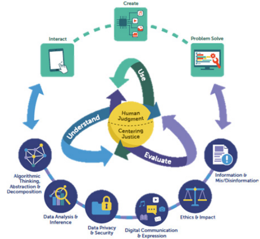
Figure 1. PRISMA Procedure

UNESCO는 AI 역량에 대한 국제적 프레임워크로서 각국의 AI 교육과정 설계의 도움을 주고자 AI CFS를 개발하였다[25]. AI 역량 프레임워크[25]의 목표는 AI의 윤리적 공동 창작자 및 책임감 있는 시민 양성이다. AI에 대한 비판적 사고 신장, AI와의 인간 중심 상호작용 강조, 환경적으로 지속가능한 AI 장려, AI 역량 개발에서의 포용성 증진, 평생학습을 위한 핵심 AI 역량 구축을 핵심원칙으로 설계되었다. <Table 2>에서 보여지듯이 인간중심 사고방식, AI 윤리, AI 기술 및 응용, AI 시스템 설계 4가지 영역으로 이해, 적용, 창작의 진행 수준에 따라 12개의 역량으로 구성되어 있다[25]. AI 학생 역량과 함께 교육과정 목표, 교육 방법 제안, 학습환경 등을 함께 제시하고 있으며 평가 시나리오도 함께 제시하고 있다.